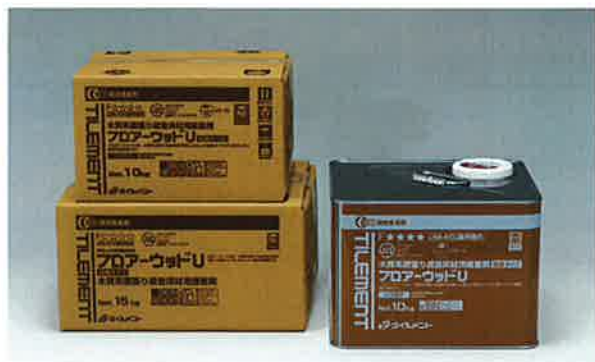
ウレタン樹脂系接着剤

フロア-ウッドUは、木質系直張り遮音床材の 施工に適した低臭タイプの一液ウレタン樹脂系 接着剤です。